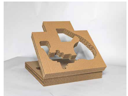
Inlays zum Klappen